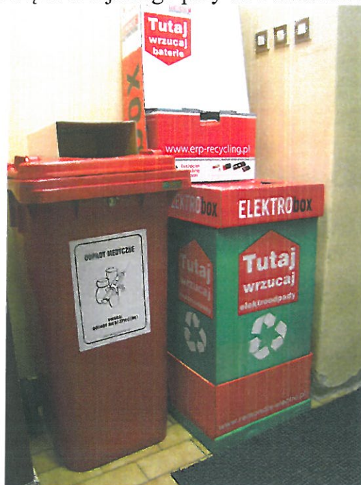
Fotografia 1 Pojemniki do zbierania przeterminowanych leków i zużytych baterii w budynku Urzędu Miejskiego przy ul. Nowakowskiego

Ponadto, mieszkańcy mają możliwość oddania zużytego sprzętu elektrycznego i elektronicznego bezpłatnie do kontenerów należących do Remondis Elektrorecykling Sp. z o.o. w Błoniu zlokalizowanego przy ul. Ekologicznej 2, wystawionych przed zakładem. Również, zużyte baterie mogą być dostarczane do punktów zakupów baterii i oddawane tam w sposób bezpłatny (zgodnie z zapisami ustawy z dnia 24 kwietnia 2009 r. o bateriach i akumulatorach (Dz. U. z 2016 r., poz. 1803 z późn. zm.), każdy sprzedawca detaliczny, posiadający placówkę handlową o powierzchni pow. 25 m 2 , powinien zorganizować bezpłatne odbieranie zużytych baterii).