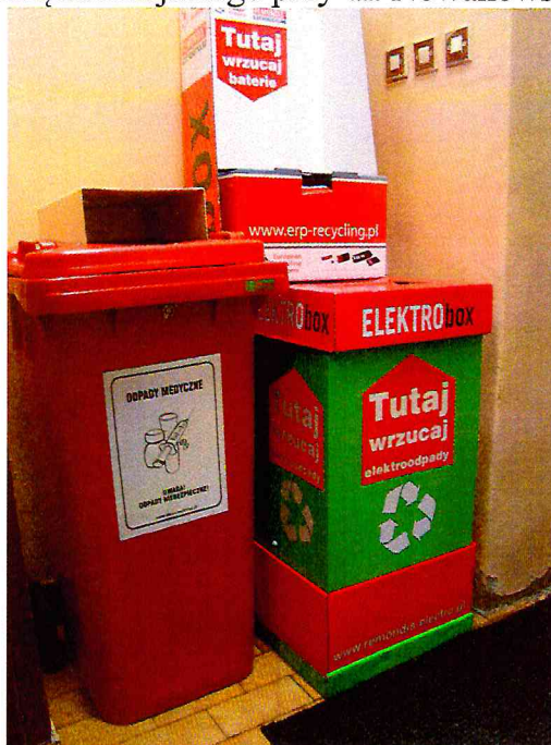
Fotografia 1 Pojemniki do zbierania przeterminowanych leków i zużytych baterii w budynku Urzędu Miejskiego przy ul. Nowakowskiego

Ponadto, mieszkańcy mają możliwość oddania zużytego sprzętu elektrycznego i elektronicznego bezpłatnie do kontenerów należących do Remondis Elektrorecycling Sp. z o.o. w Błoniu zlokalizowanego przy ul. Ekologicznej 2, wystawionych przed zakładem. Również, zużyte baterie mogą być dostarczane do punktów zakupów baterii i oddawane tam w sposób bezpłatny (zgodnie z zapisami ustawy z dnia 24 kwietnia 2009 r. o bateriach i akumulatorach (Dz. U. z 2016 r., poz. 1803 z późn. zm.), każdy sprzedawca detaliczny, posiadający placówkę handlową o powierzchni pow. 25 m 2 , powinien zorganizować bezpłatne odbieranie zużytych baterii).